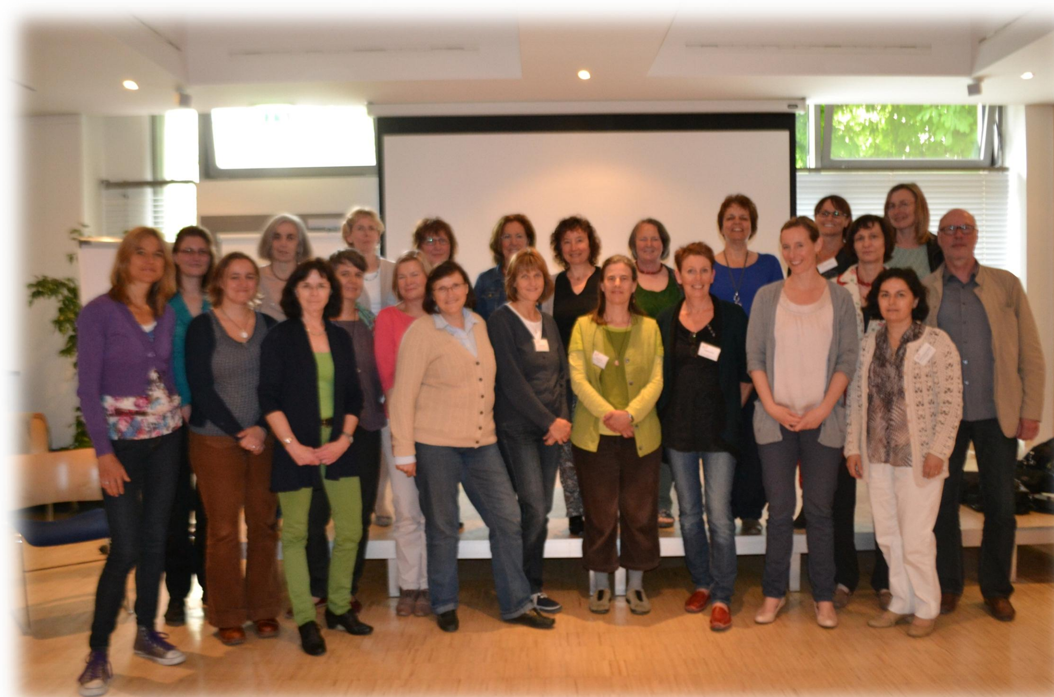
sibe-Kurs 1 Region München nach der Zertifikatsverleihung