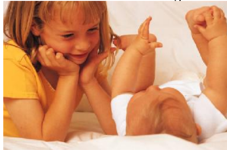
Sprachliche Bildung und Entwicklung bei Kindern unter 3 Jahren