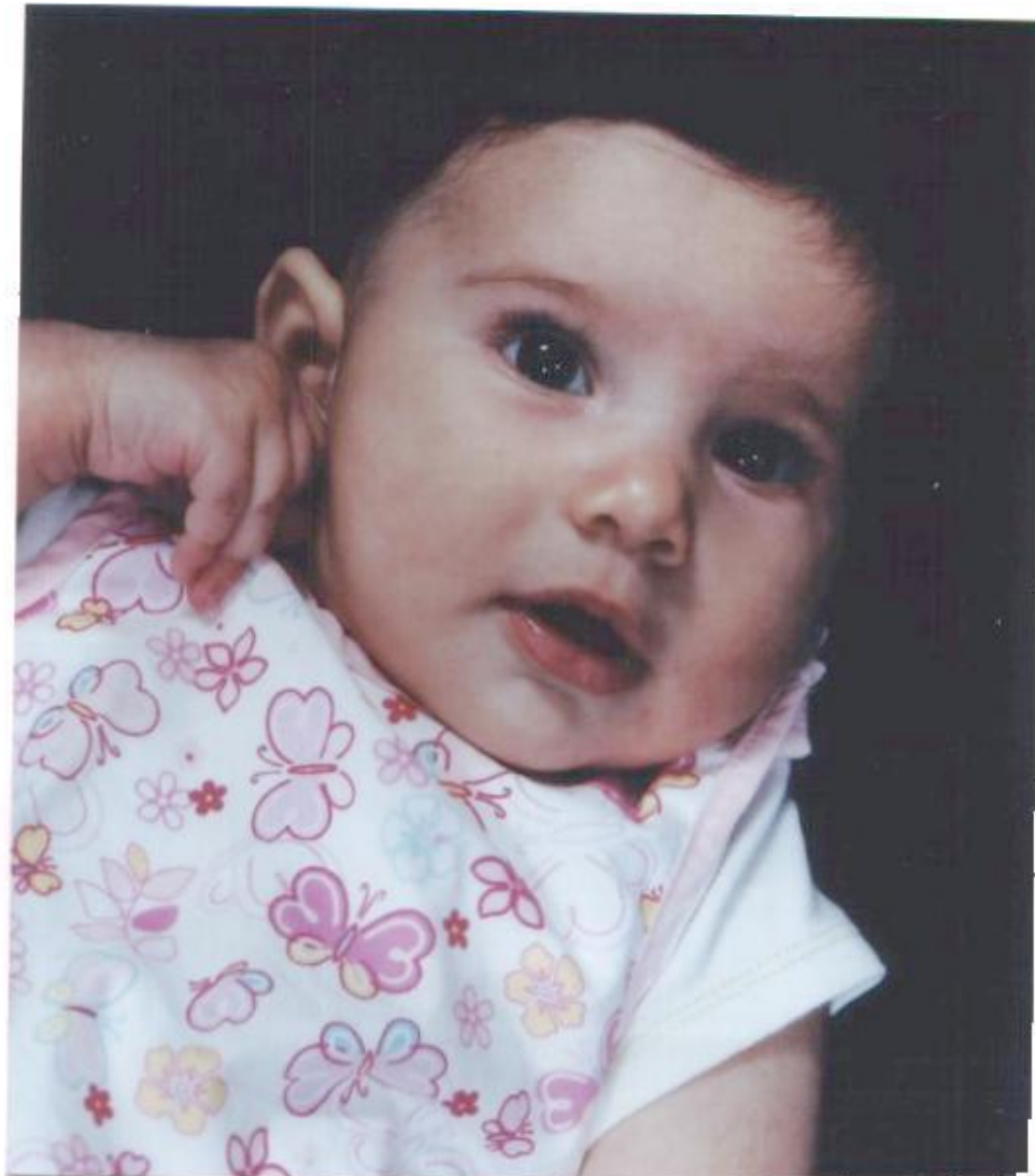
unter 3 Jahren