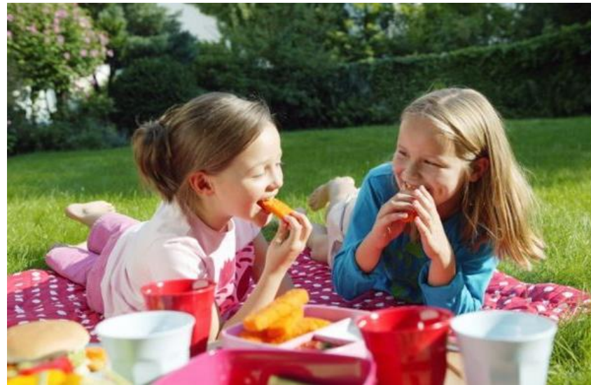
Sprachliche Bildung und Entwicklung bei Kindern unter 3 Jahren