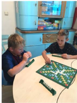
vor oder nach dem Spielen

selbstbestimmte, eigenverantwortliche Erledigung der Hausaufgaben