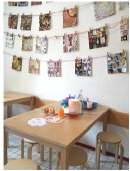
vor oder nach dem Essen