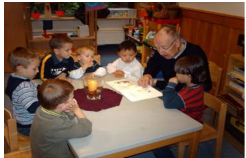
SeniorInnen als Bildungspaten