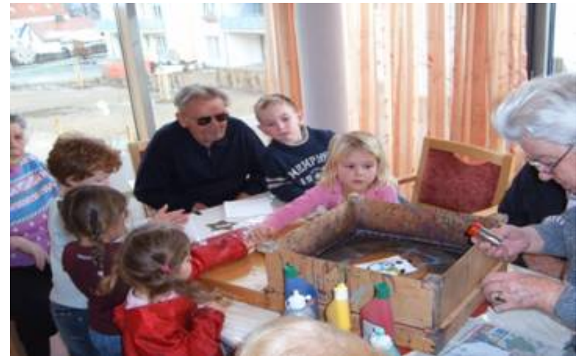
Brücke zwischen Jung und Alt