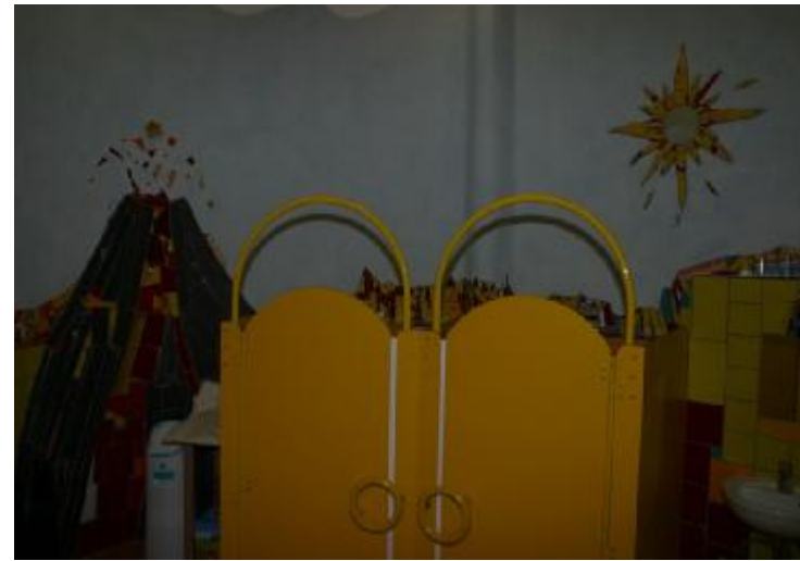
Beispiel Bad Gruppe Feuer