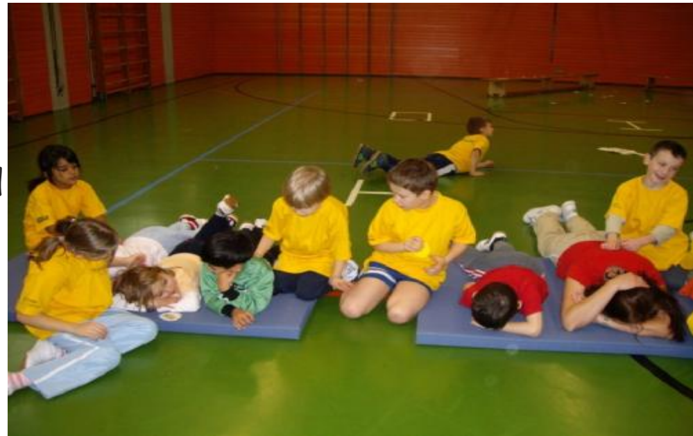
Gemeinsame Sportstunde in der Schule