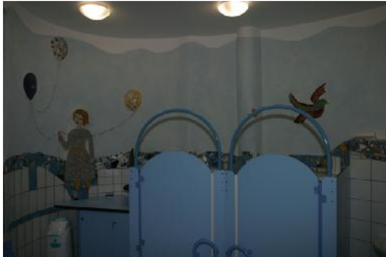
Beispiel Bad Gruppe Luft