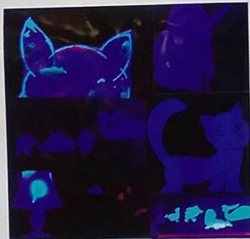
alljährliches Lichttheater: miteinander ein Lichtspieltheater planen, gestalten, auführen