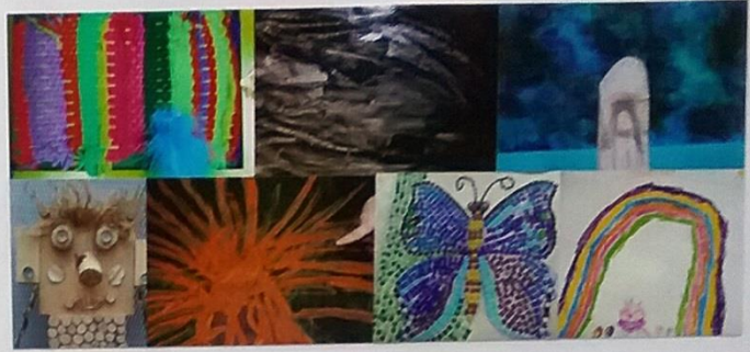
Mit Farben und Formen experimentieren