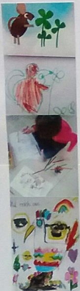
Projekt: Ausstellung zum Karneval: Kinder lassen sich von Karol inspirieren

Bereiche unserer Förderung im Hort Christkönig