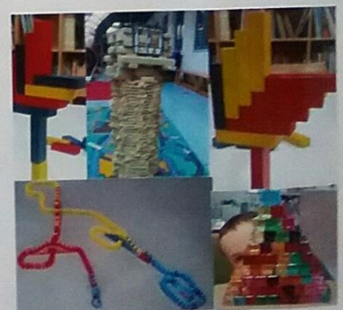
Geschicklichkeit, Ausdauer und Konzentration trainieren