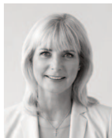
Ulrike Scharf, MdL Staatsministerin für Familie, Arbeit und Soziales

Professionalität und Praxisnähe: Dafür steht das IFP. Das Institut gilt heute als die Marke für Frühpädagogik und Medienkompetenz – in Bayern, Deutschland und darüber hinaus. Die wissenschaftlichen Referentinnen und Referenten fördern spannende Erkenntnisse zutage. Ihre Projekte haben Signalcharakter, weil sie sich den großen Herausforderungen unserer Zeit widmen.